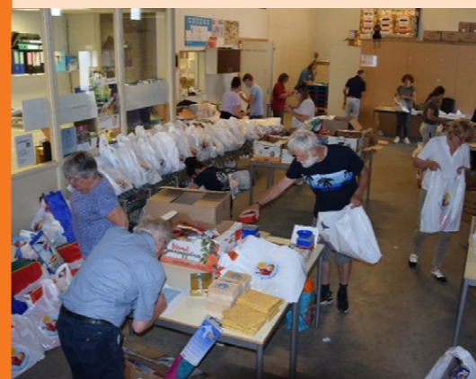
In het najaar in ons huidige pand van eigenaar gewisseld. De nieuwe eigenaar was feitelijk al jarenlang onze buurman omdat wij beiden de huisvesting huurden van een derde partij. Voor de Voedselbank heeft deze wijziging op korte termijn geen gevolgen omdat het huurcontract nog tot april 2029 doorloopt.

Op korte termijn heeft samenwerking met qlant