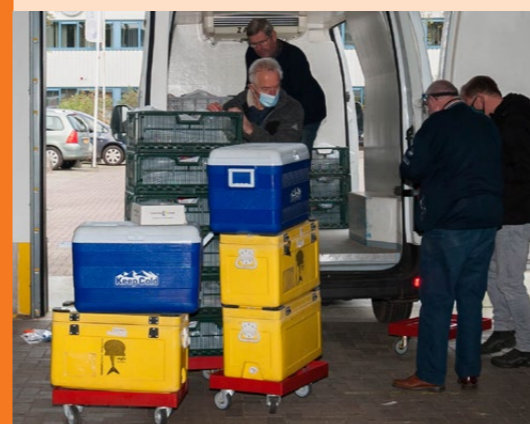
Het is lastig om de hele keten voor ingevroren en gekoelde producten te garanderen tot aan de voordeur.